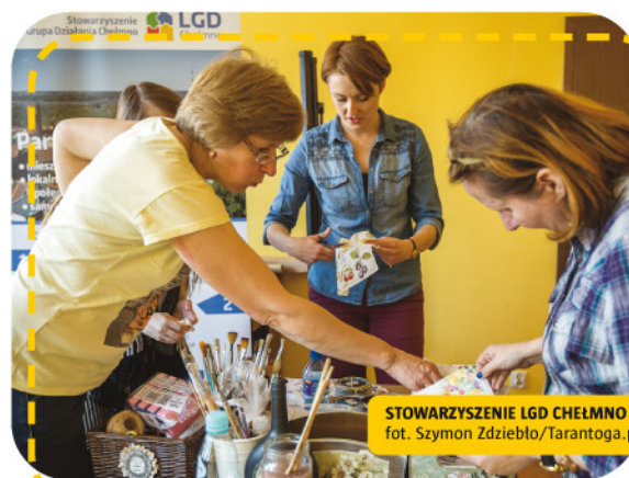
STOWARZYSZENIE LGD CHEŁMNO

Stowarzyszenie LGD "Czarnoziem na soli" Stowarzyszenie LGD Inowrocław Stowarzyszenie "Partnerstwo dla Ziemi Kujawskiej" LGD Pałuki Wspólna Sprawa Wąbrzeska Stowarzyszenie LGD Ziemia Wąbrzeska Stowarzyszenie LGD Chełmno Stowarzyszenie LGR "Nasza Krajna i Pałuki"