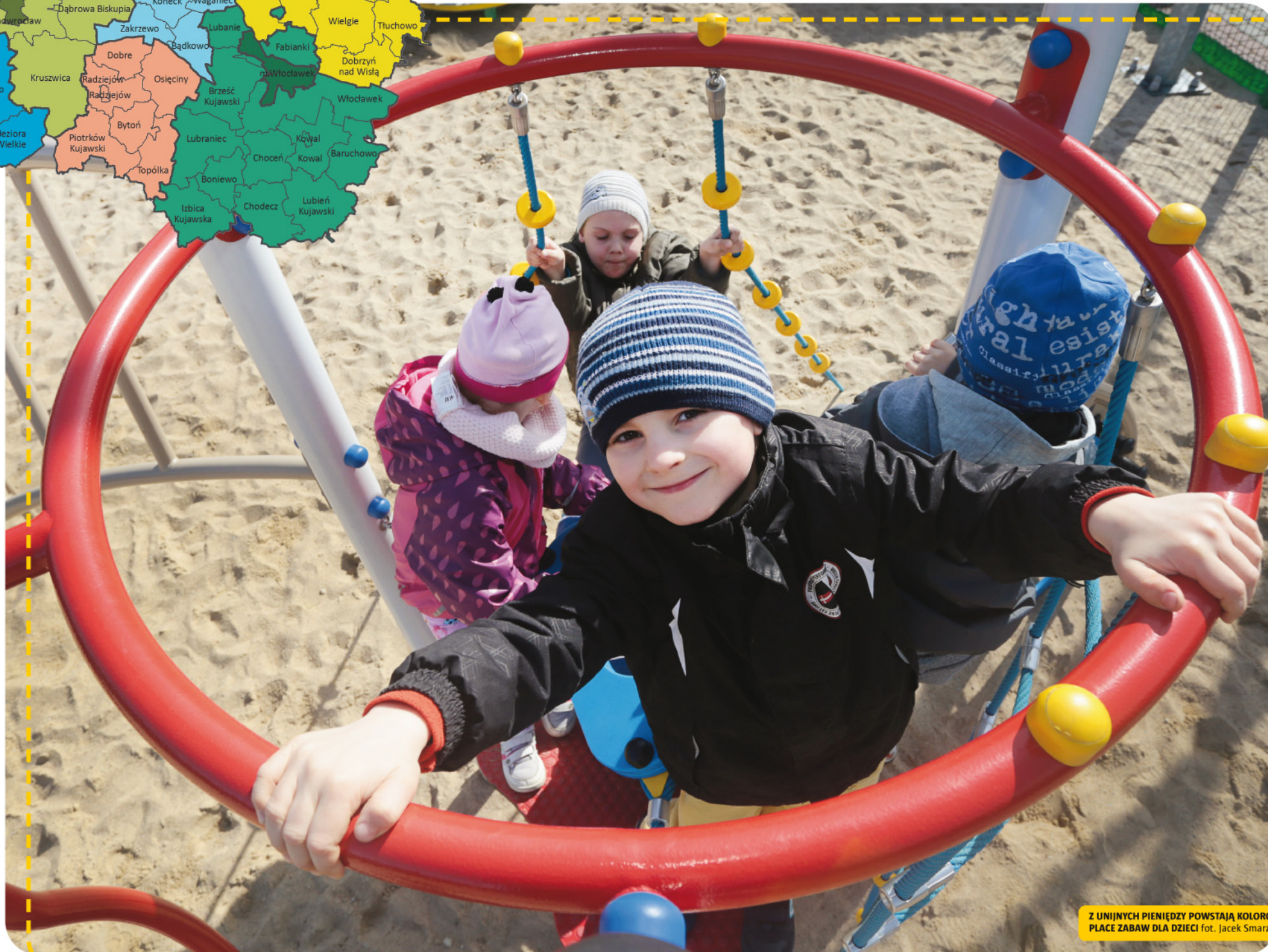
Z UNIJNYCH PIENIĘDZY POWSTAJĄ KOLOROWE PLACE ZABAW DLA DZIECI

korzystać z tych instrumenty aktywnej integracji, przykładowo – skierowanie podopiecznego na praktykę lub staż, opłacenie jego zajęć zawodowych lub edukacyjnych, sfinansowanie studiów młodzieży opuszczającej placówkę wychowawczą. Szerszy katalog możliwych do realizacji instrumentów znajdziemy w dokumentach Urzędu Marszałkowskiego.